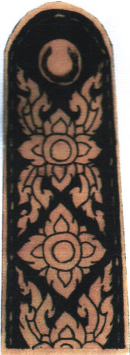
ประธานสภาเกษตรกรแห่งชาติ และรองประธานสภาเกษตรกรแห่งชาติ