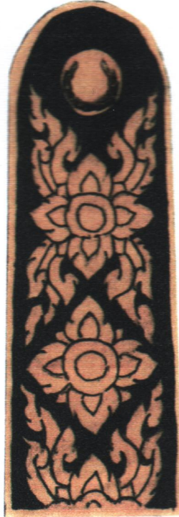
สมาชิกสภาเกษตรกรแห่งชาติ และประธานสภาเกษตรกรจังหวัด